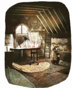
«¿Tjéje? ¿Estás ahí dentro? ¿Tjéje?»

Más información: comunicacion@editorialflamboyant.com