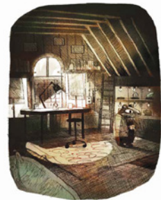
Tèssé, que hi ets? Ennn, Tèsséssé...

Més informació: comunicacion@editorialflamboyant.com