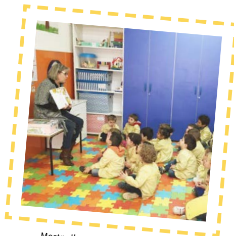
Mestra llegint el conte als infants: Escola Andersen, Terrassa, Barcelona