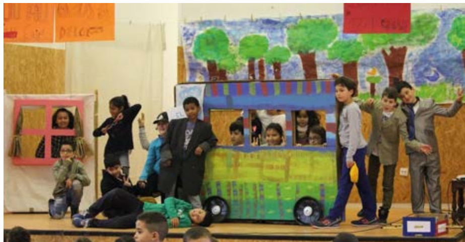
Escola Antoni Gaudí Alumnes de 3r A i B del curs 2016-17

4. Transformem un espai de l'escola o de l'entorn en benefici de tothom: les accions sorgiran de les propostes que els alumnes, democràticament, decideixin. La mirada positiva dels nens i nenes ens pot portar a reconvertir o recuperar espais: l'hort d'una escola, fer d'un sotaescala un racó de lectura acollidor, plantar flors als escocells del pati o propers a l'escola, donar un nou ús a tot allò que estava infrautilitzat, com ara passadissos amplis o racons del pati, ja sigui per jugar, descansar, relaxar-se, fer exposicions, etc.